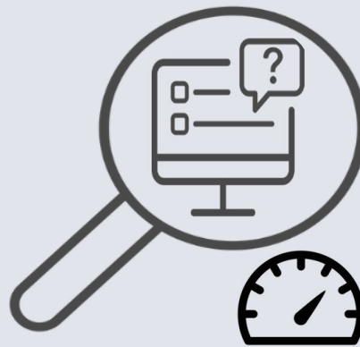
Reifegradanalyse, -Bewertung & -Visualisierung