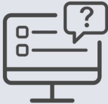
Best in Class Referenz- & Reifegrad Modell Cloud Service (Fragenkatalog)

Das Zusammenspiel zwischen Reifegrad-Fragenkatalog und Reifegradbewertung → Die Existenz der digitalen Basiselemente (DBE) resp. der standardisierten, elementaren, digitalen Fähigkeiten ( \cong DBE) sowie deren generischen und/oder branchenspezifischen Ausprägungen (Good- & Best-Practices) wird auf Basis des Reifegrad-Fragenkataloges analysiert, gewichtet bewertet und anschließend visualisiert.