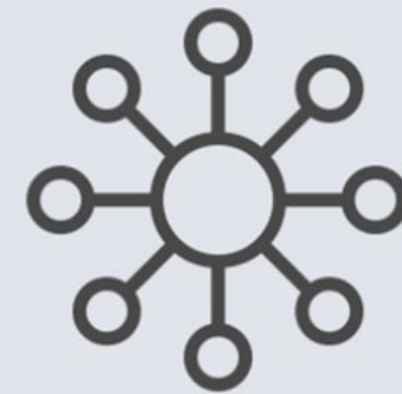
Ableitung der Digitalisierungsstrategie

Standardisierte, digitale Bewertungsmaßstäbe ermöglichen die Konzeption dedizierter Digitalisierungsstrategien!